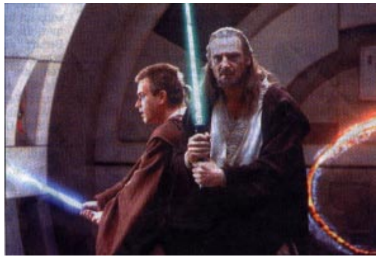
Mit Ihren Laserschwertern kämpfen die wendigen Jedi-Ritter gegen das Böse.

Nach Eintritt in die Kinosaale wurden die Gäste noch etwas auf die Folter gespannt. Während im ersten Saal eine Lasershow und Nebelschwaden die Besucher begeisterte, spielte in anderen Räumen lediglich Radiomusik.